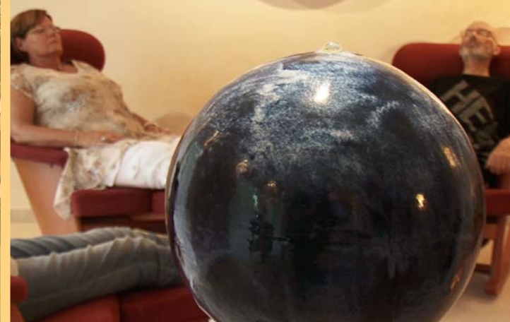
Entspannung zwischendurch ...