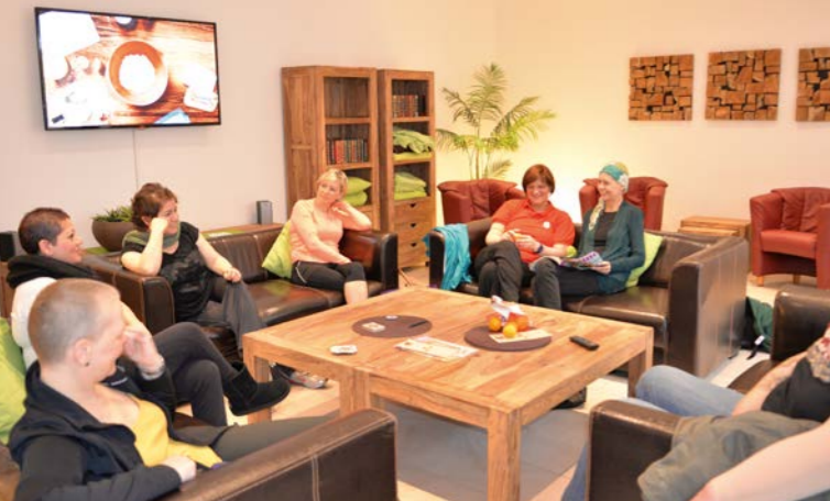
Rückzugsorte nach den Therapien