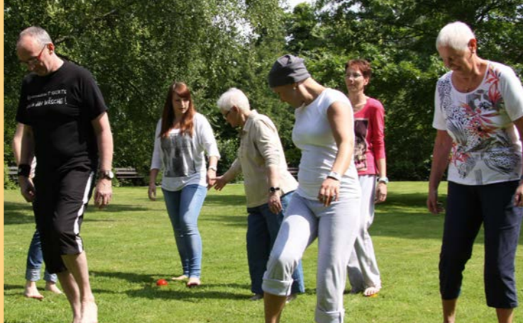
Therapien auch im Klinikpark