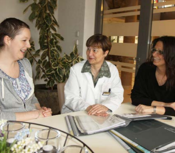
Patienten-Arzt-Gespräche im kleinen Kreis

Ergänzt wird dies durch zusätzliche neuro-psychologische Diagnostik : Bestimmung der Konzentrationsfähigkeit/Aufmerksamkeit, Austestung der geistigen Leistungsfähigkeit.