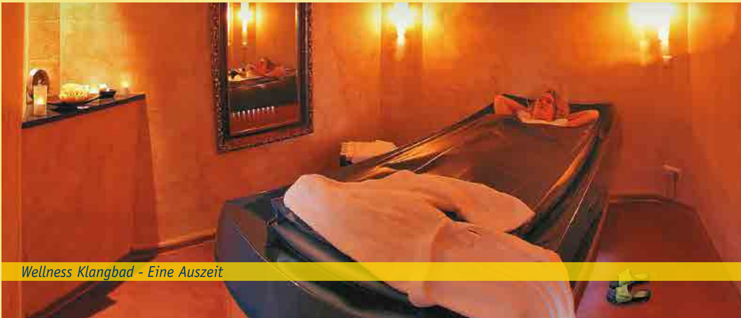
Wellness Klangbad - Eine Auszeit