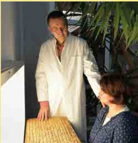
Innere Ruhe durch Lichttherapie