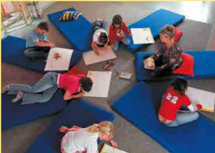
Sternstunde für die Kinder