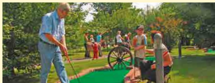
Minigolfanlage im Park