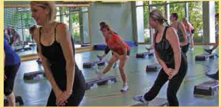
Sporttherapie bei flotter Musik