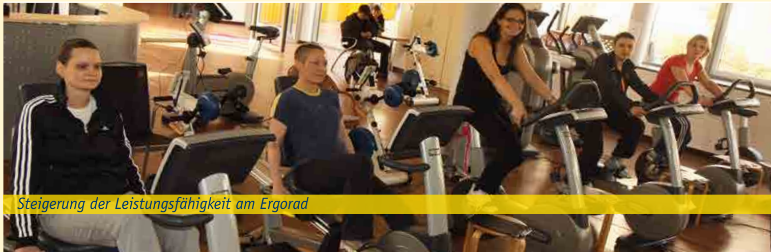
Steigerung der Leistungsfähigkeit am Ergorad