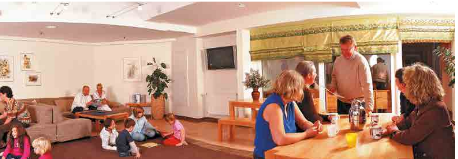
Gemütlichkeit im Aufenthaltsbereich

Zwischen den Therapien sowie zum Ausklang eines Tages finden Mütter, Väter und Kinder im gemeinsamen Aufenthaltsbereich mit altersentsprechendem jungen Ambiente jederzeit die Möglichkeit des Austausches untereinander.