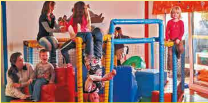
Gemeinsamer Spaß im Kinder-Aufenthaltsbereich