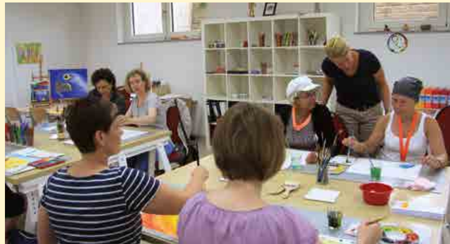
Entspannung in der Kunst-Therapie

Ein Gesundheitsbildungsprogramm mit Informationen zur individuellen Erkrankung, Prothetik, gesunder Lebensweise, Ernährung, Nicht-rauchertraining, Stressbewältigung und Umgang mit Fatigue/Erschöpfung vervollständigen unser Angebot.