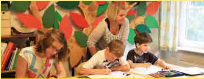
Unterricht in der Oexen Schule