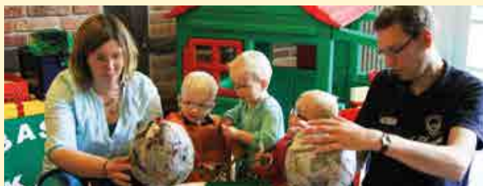
Wieder gemeinsames erleben

Selbstverständlich bieten die Klinikanlagen auch Kinderspielplätze und weitere kindergerechte Einrichtung wie z.B. Adventure Minigolf, Beachvolleyball- und Basketballplätze sowie Leihräder.