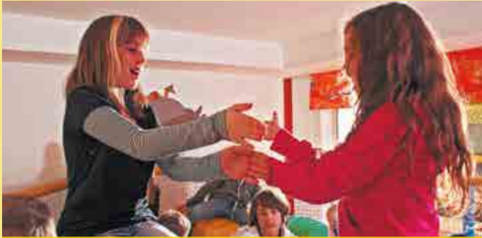
Freundschaften - schnell geknüpft

Eine Möglichkeit der Entlastung der Mutter/des Vaters ist das gemeinsame Mittagessen der Kinder in der Kinderbetreuung des Oexer Hofes.