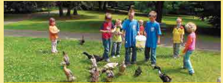
Immer was los für die Kleinen

Die Finanzierung des Aufenthalts der Kinder erfolgt in der Regel im Rahmen der Bewilligung einer „Übernahme von Unterbringungskosten anstelle von Haushaltshilfe für sonst zu Hause versorgte Kinder“ durch den zuständigen Kostenträger.