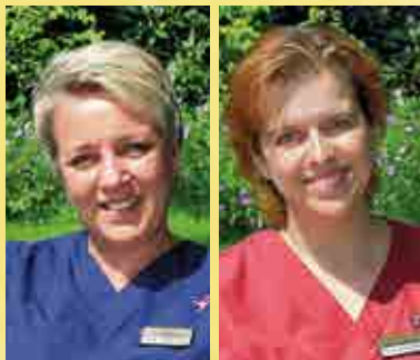
Unser bewährtes Breast Care Nurses Team

Selbsthilfefreundlichkeit und Patientenorientierung im Gesundheitswesen