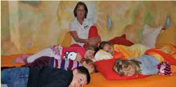
Auch Kinder können entspannen