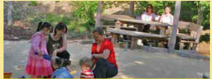
Spiel + Spass im Park